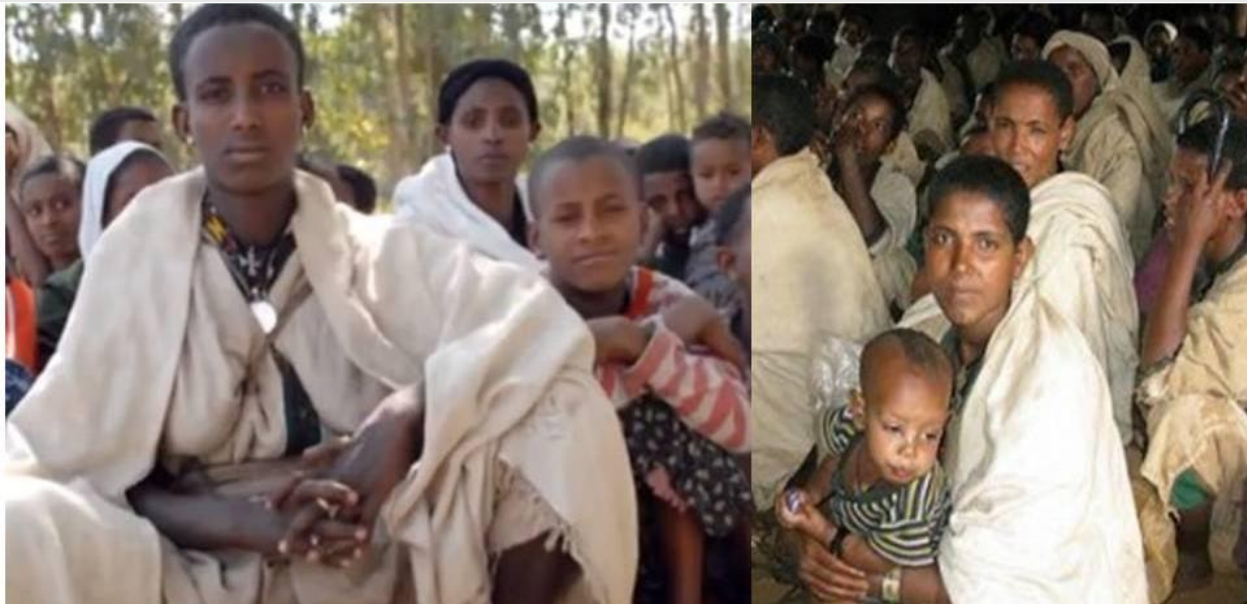
በበለጠ ዝርዝር መረጃውን በድህረ - ገጻችን http://www.moreshwegenie.org ላይ ይመልከቱ።